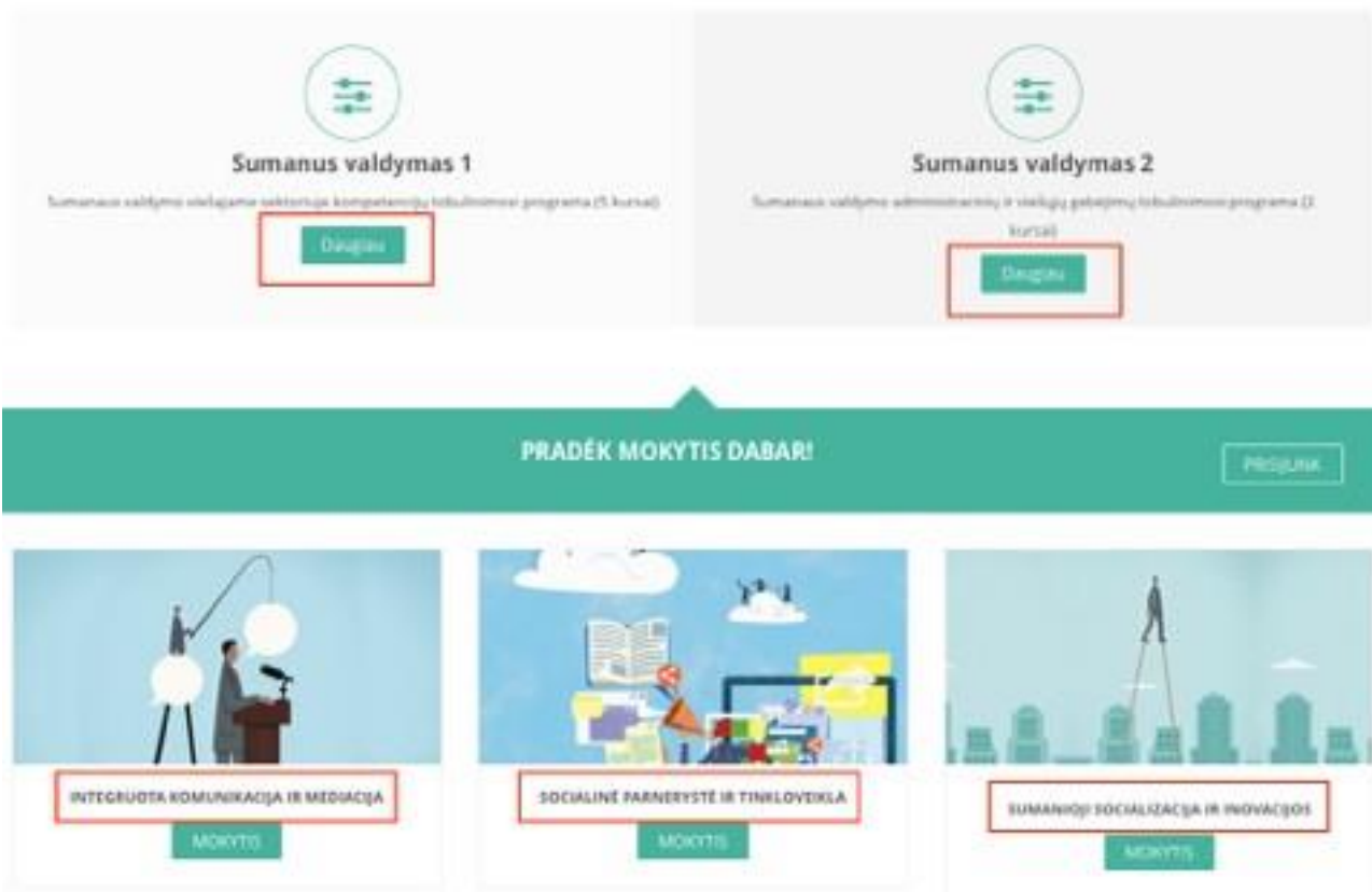
3 pav. Kursai